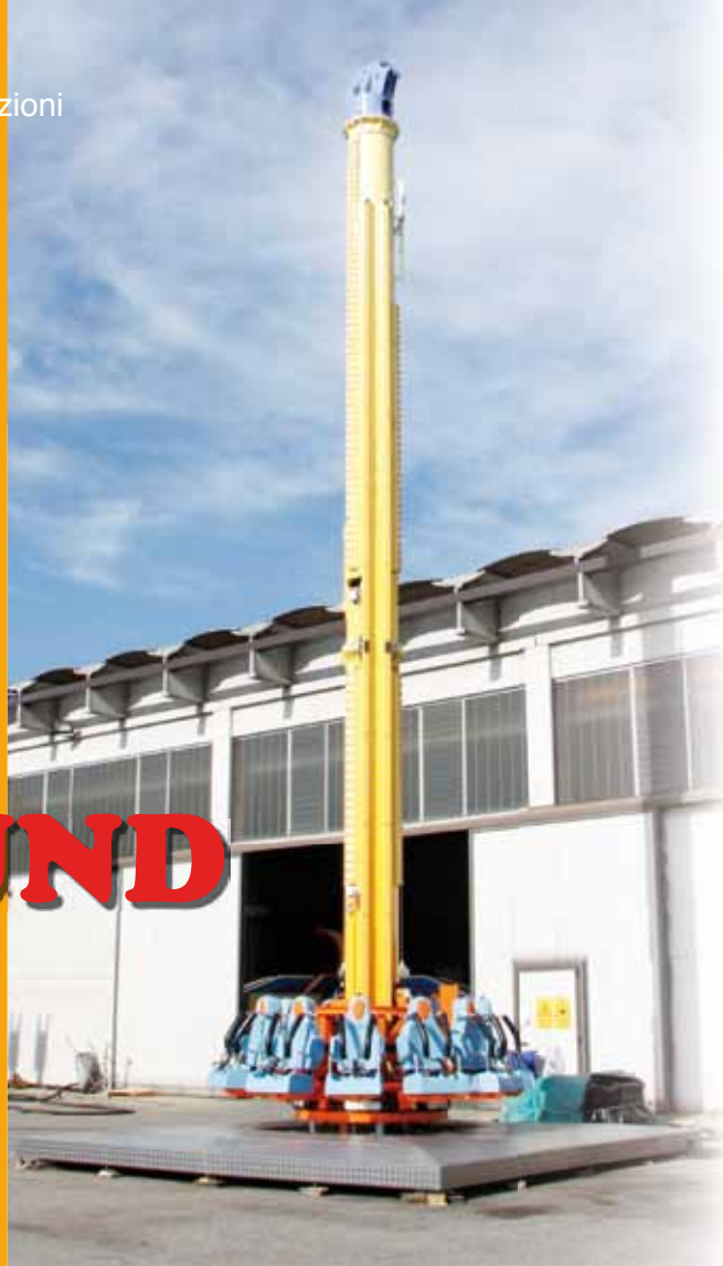
Un altro modello di torre a caduta firmato SBF-VISA Group

That ‘something more’ starts from the design – which must always be effective and in this attraction involves a circular shuttle with 12 seats whose shape is reflected in the ring decorations – but above all is expressed in a new movement